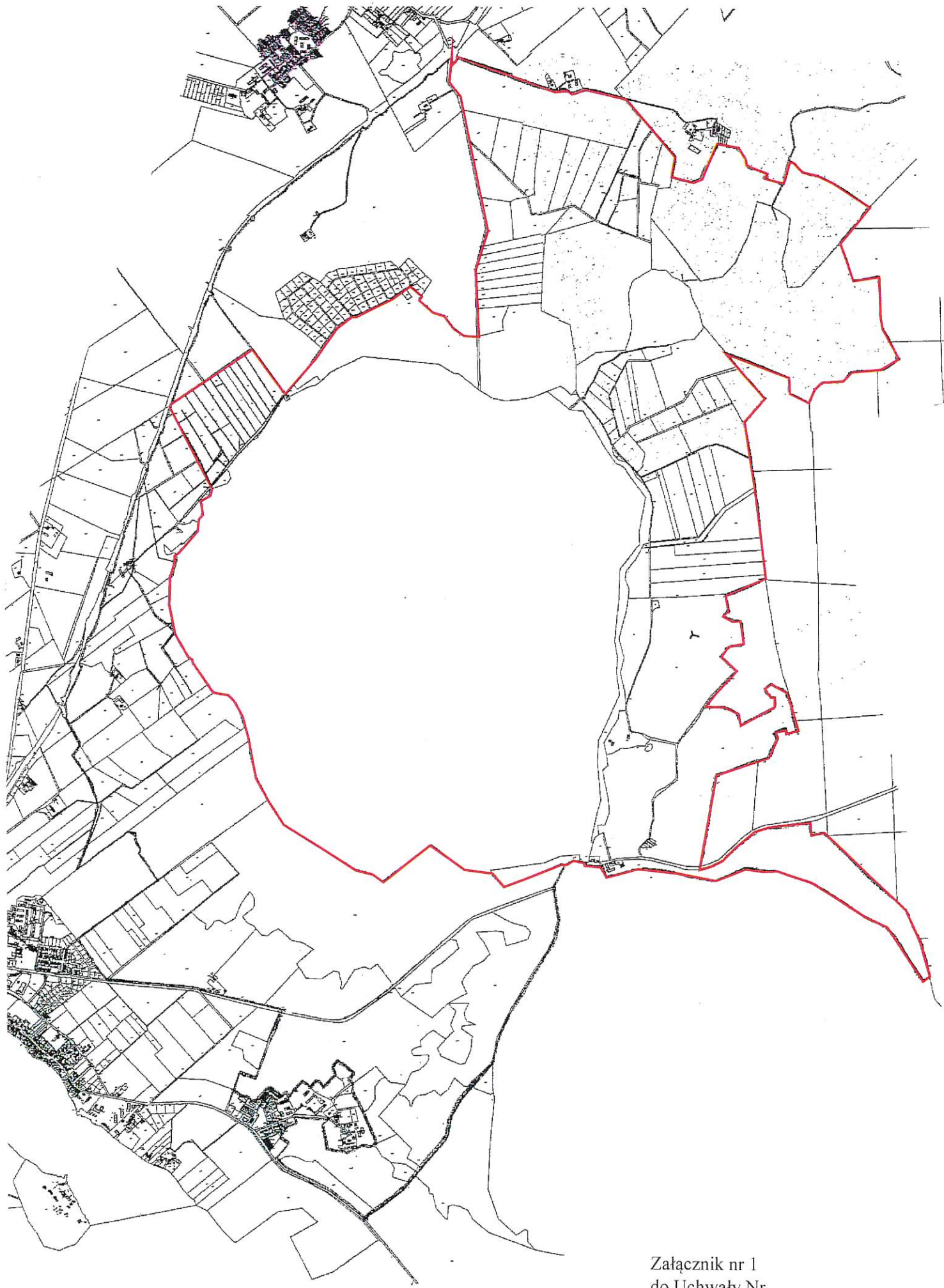
Załącznik nr 1 do Uchwały Nr ..... Rady Miejskiej w Mikołajkach z dnia .....